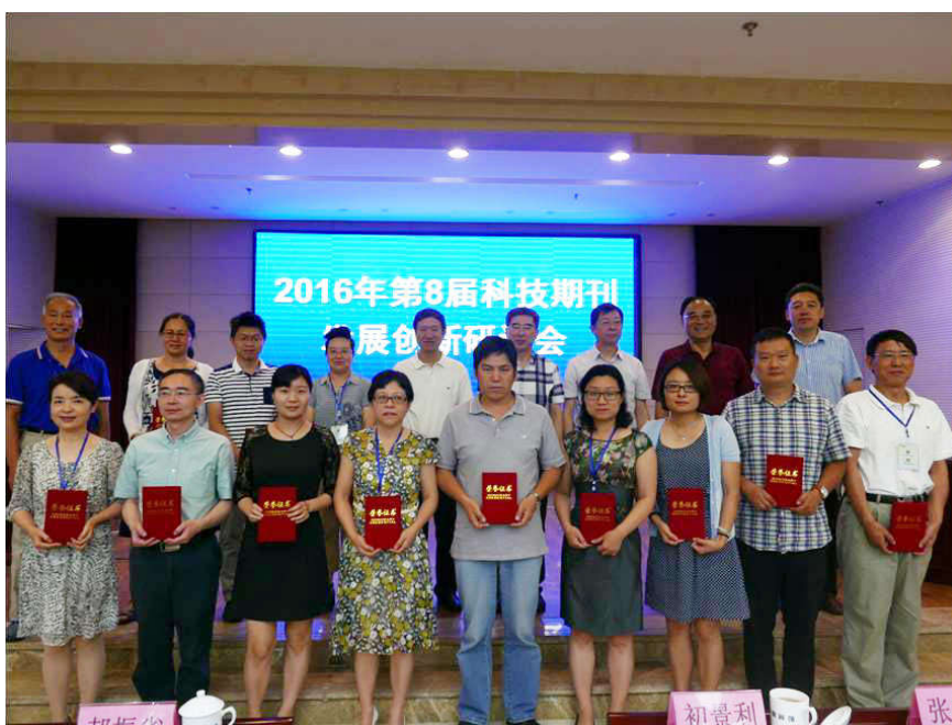
2016 年科技期刊发展创新研讨会，领导和嘉宾为论文获奖人员颁奖