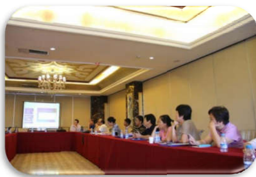
2015 年科技期刊发展创新研讨会，辅导办刊座谈会现场