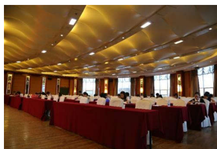
2015 年科技期刊发展创新研讨会，参加编辑技能竞赛的人员正在认真答题