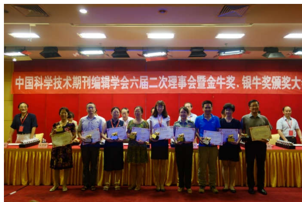
图 2 第五届金牛奖获奖者

学会于 1997 年设立奖项——“金牛奖”、“银牛奖”。通过对该奖项的评审和宣传，“金牛奖”、“银牛奖”不仅已经成为了学会的一个品牌，获得该奖项更是被广大科技期刊编辑认为是一种职业荣耀，得到了全体会员和广大科技期刊编辑的高度认可。自设立“金牛奖、银牛奖”奖项以来，其评审和颁奖工作由组织工作委员会具体实施。在整个评奖过程中，组织工作委员会严格遵守评奖规则，规范组织评审流程。“金牛奖”和“银牛奖”每届评选一次，现已评选 5 届，其中“金牛奖”获奖者 380 名，“银牛奖”获奖者 1033 名。图 2 是 2016 年第五届部分金牛奖获奖者。