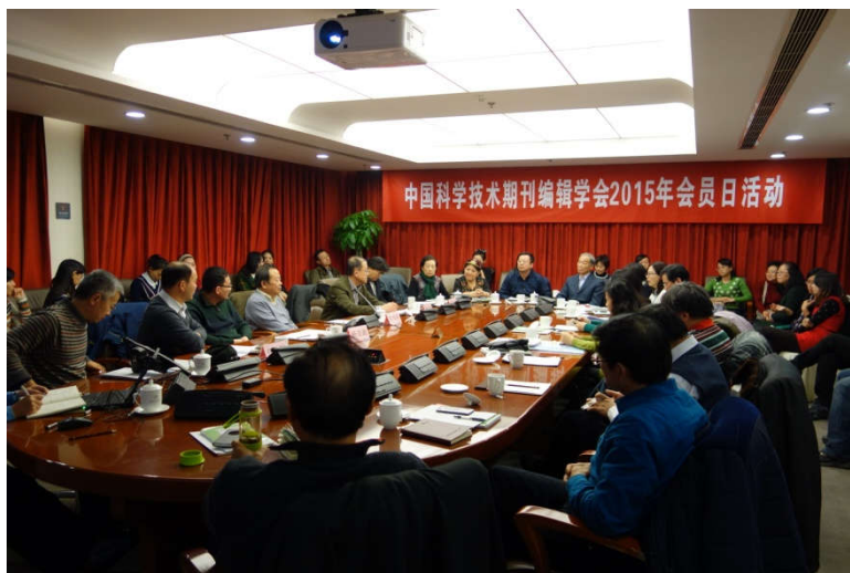
图 3 2015 年会员日活动

通过这些年的发展，学会的会员建设与管理工作的基本建立了多元化的会员结构与多层次的服务体系。举例来说，每年，组织工作委员会对于学会举办的各种学术会议、培训班，组织开展各种评优活动，都会在第一时间及时通知到会员单位，都会积极组织会员参加，以此不断加强学会与广大会员的联系，不断提高学会在会员心中的地位；在日常或相关会议活动现场，组织工作委员会成员都会及时解答会员提出的问题，尽可能帮助解决；在新年前后，还会想会员单位和理事寄去新年贺卡或组织新春联谊会，或者在每位理事生日时寄去祝福贺卡；每年组织会员日活动，学会领导与会员面对面沟通，听取他们的需求等等，我们在通过细致、热情、周到的服务联络学会和会员之间的感情，不断增强学会的凝聚力。图 3 是 2015 年会员日活动现场。